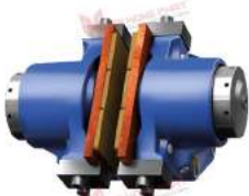
Caliper brake KTR