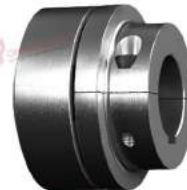
Shaft Coupling Reflex H