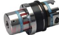
Khớp nối bảo vệ quá tải KBK EPK