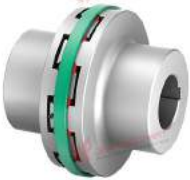
Khớp nối trực TNB BH