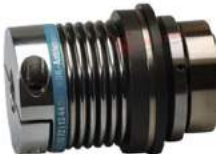
Khớp nối bảo vệ quá tải KBK BKA