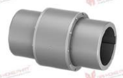
Khớp nối răng TNZ ZCHUU