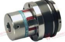
Khớp nối bảo vệ quá tải KBK EPP