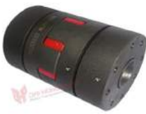
Khớp nối Servo RJB