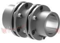
Khớp nối đĩa thép TND HDH