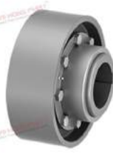
Khớp nối răng TNZ ZCA-BT/ZCB-BT