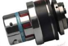
Khớp nối bảo vệ quá tải KBK EKI