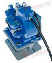
Hệ thống phanh