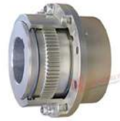
Khớp nối răng Westcar RE/FO