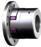
Khớp nối trực Rotex CF