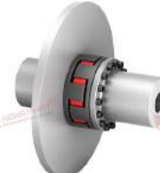
Khớp nối trực TNS SDDL-5