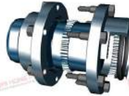
Khớp nối răng vỏ thép JAC SSM