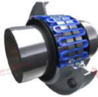
Khớp nối lưới lò xo PT T20