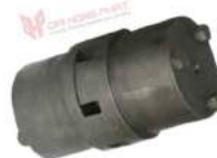
Khớp nối Type RRL