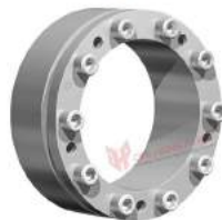
Khớp khóa trục RfN 7013