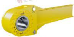
Low Speed Backstops