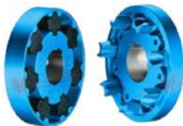
Khớp nối Flender N-Eupex DS