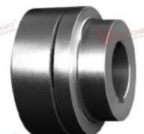
Shaft Coupling Reflex N