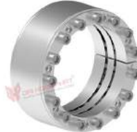
Khớp khóa trục RfN 7515