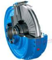
Khớp nối thủy lực Flender Fluidex