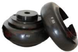
Vòng đệm bánh xe Fenaflex