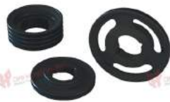
Ống lót côn Cross Morse