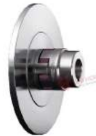
Khớp nối trực Rotex SBAN