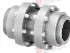
Khớp nối răng TNZ ZCAZ/ZCBZ