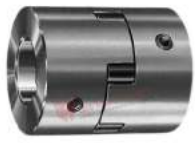
Khớp nối Martin ML