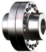
Pin and Bush Coupling Revolex KX-D made of steel