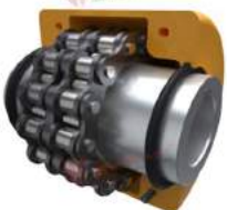
Khớp nối xích PTI