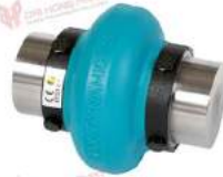
Khớp nối trực Max Dynamic HS