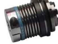
Khớp nối bảo vệ quá tải KBK BKI