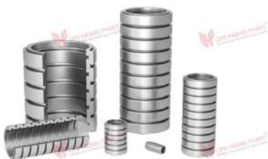
Lò xo côn giảm sóc