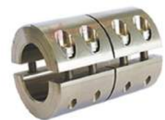
Khớp nối cứng KBK KBST-G-VA

CÔNG TY ĐẠI HỒNG PHÁT - ĐẠI DIỆN ỦY QUYỀN KBK GERMANY DUY NHẤT TẠI VIỆT NAM