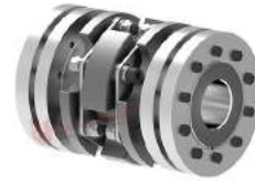
Khớp nối đĩa thép TND QCQ