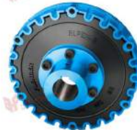
Khớp nối bánh xe Elpex-S