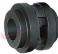
Khớp nối Fenner HRC