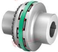
Khớp nối trực TNB BHD