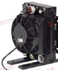
Oil/Air Cooler 2 - 350 kW