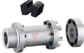
Khớp nối Flender N-Eupex H