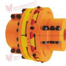
Khớp nối tháo lắp nhẹ