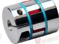
Khớp nối Servo KBK KBE2C