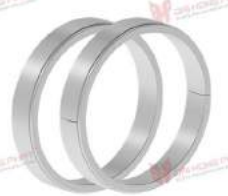
Vòng siết trục côn RfN 8006