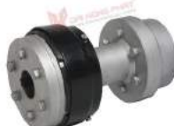
Khớp nối Type SWS