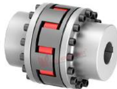
Khớp nối trực TNS SDD-5