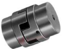
Khớp nối Lovejoy Rathi Dạng L