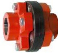
Khớp nối trục Westcar Rotoflexi