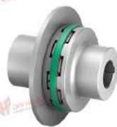
Khớp nối trực TNB BHD-BS