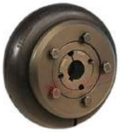
Khớp nối bánh xe Fenaflex