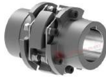
Khớp nối đĩa thép TND OCO