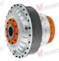
Khớp nối thủy lực Henfel