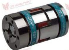
Khớp nối Servo KBK KBE3