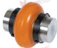
Khớp nối trực Max Dynamic