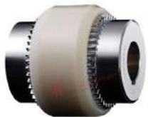
Khớp nối răng Bowex M