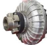
Khớp nối thủy lực Westcar Rotofluid