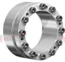
Khớp khóa trục RfN 7004