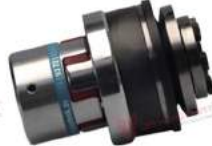
Khớp nối bảo vệ quá tải KBK EPI