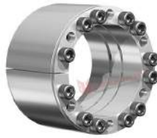
Khớp khóa trục RfN 7005