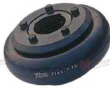
Khớp nối bánh xe Martin Flex