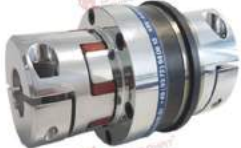
Khớp nối bảo vệ quá tải KBK EHH