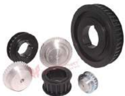
Timing Belt Pully