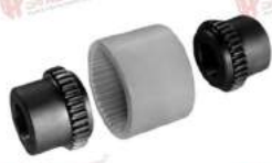
Khớp nối răng GF