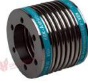
Khớp nối lò xo Encoder KBK KB7