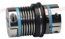
Khớp nối bảo vệ quá tải KBK BKK

CÔNG TY ĐẠI HỒNG PHÁT - ĐẠI DIỆN ỦY QUYỀN KBK GERMANY DUY NHẤT TẠI VIỆT NAM