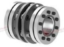
Khớp nối đĩa thép TND XSX