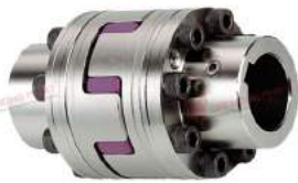
Khớp nối trực Rotex AFN