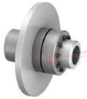
Khớp nối Nor-mex TNM GH5