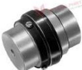
Khớp nối Type SW