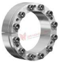
Khớp khóa trục RfN 7003