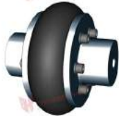
Khớp nối bánh xe cao su JAC CA