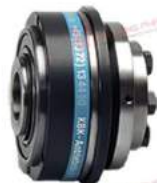
Khớp nối bảo vệ quá tải KBK LI