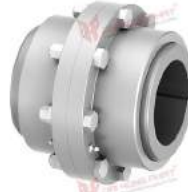
Khớp nối răng TNZ ZCAV/ZCBV