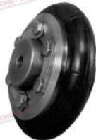
Khớp nối bánh xe PTI