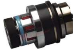
Khớp nối bảo vệ quá tải KBK EAA