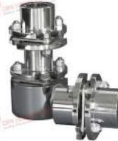
Khớp nối đĩa thép Westcar