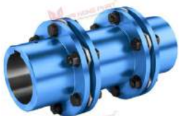
Khớp nối đĩa thép N-Arplex