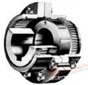
Khớp nối răng LFG/FHG