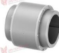
Khớp nối răng TNZ ZCH