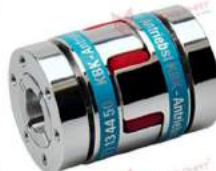
Khớp nối Servo KBK KBE3C