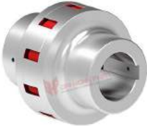
Khớp nối trực TNS S-St