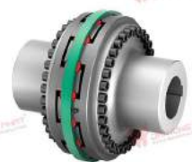
Khớp nối trực TNB BHDDVV