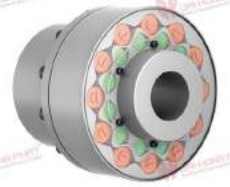
Khớp nối trực TNR 2428.2