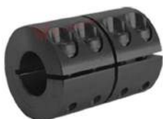
Khớp nối cứng KBK KBST