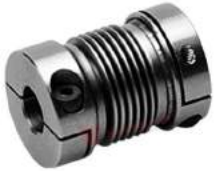
Khớp nối lò xo Encoder KBK KB2VA