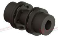
Khớp nối đĩa Mark