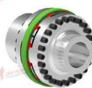
Khớp nối trực TNB BHDD