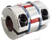
Khớp nối Servo KBK KBE2HC