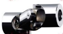
Khớp nối cardan dạng đôi