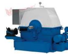
Khớp nối điều chỉnh tốc độ