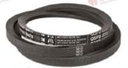
Dây curoa Ultra PLUS