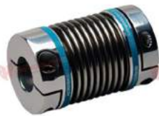
Khớp nối lò xo Encoder KBK KB2