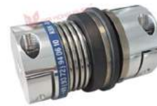
Khớp nối bảo vệ quá tải KBK BHH