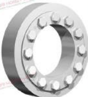
Thiết bị bóp trục RfN 4181