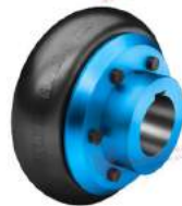
Khớp nối bánh xe Elpex-B