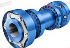
Khớp nối đĩa thép Arpex ART TURBO