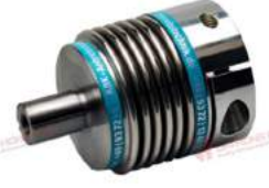
Khớp nối lò xo Encoder KBK KB8