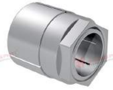
Khớp khóa trục RfN 7070