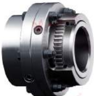
Gear Coupling Gearex