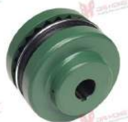
Khớp nối Sure-Flex