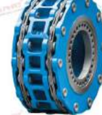
Khớp nối điện gió Arpex Giga