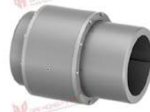
Khớp nối răng TNZ ZCHAU