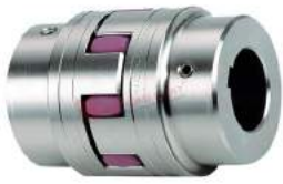
Khớp nối trực Rotex Standard