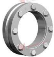
Thiết bị bóp trục RfN 4051