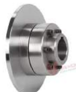
Khớp nối trực Poly-norm ADR-SBA