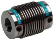
Khớp nối lò xo Encoder KBK KB1