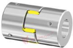
Khớp nối trực GWE 5102