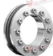
Thiết bị bóp trục RfN 4061 SST