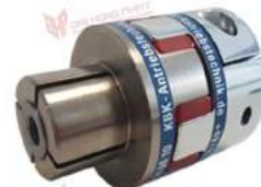
Khớp nối Servo KBK KBE4