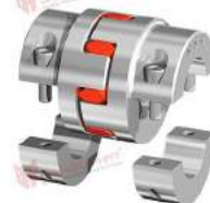
Khớp nối trực GWE 5106