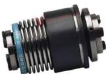
Khớp nối bảo vệ quá tải KBK BII