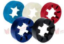
Vòng đệm Martin Go-Flex