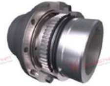
Khớp nối răng vỏ thép PT PSS/PCC