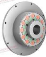
Khớp nối trực TNR 2424.2