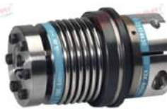
Khớp nối bảo vệ quá tải KBK BAK