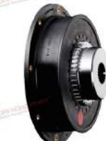
Khớp nối răng Bowex Elastic HE1/HE2