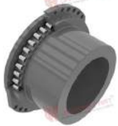
Khớp nối răng Westcar AR