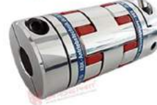
Khớp nối Servo KBK KBE2D