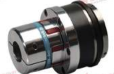
Khớp nối bảo vệ quá tải KBK EKP