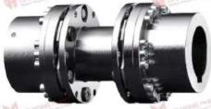
Steel Coupling Rigiflex-N