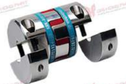
Khớp nối Servo KBK KBE2H