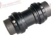
Khớp nối Type RRS