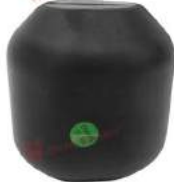
Cao su giảm chấn Renold PM