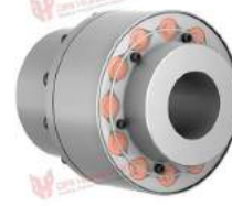
Khớp nối trực TNR 2428.1