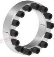
Khớp khóa trục RfN 7012