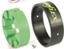
Vòng đệm giảm chấn Wrapflex