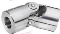
Khớp nối cardan GR/HR (dạng đơn)