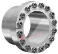
Khớp khóa trục RfN 7110