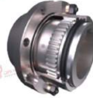
Khớp nối răng vỏ thép PT PG20