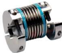
Khớp nối lò xo Encoder KBK KB2H