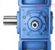
Hộp số giảm tốc

A COUPLING SOLUTION FOR ALL APPLICATIONS - GIẢI PHÁP KHỚP NỐI TRỤC CHO MỌI ỨNG DỤNG