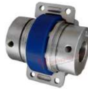
Khớp nối Martin Go-Flex GF