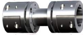
Steel Coupling Rigiflex-N AH