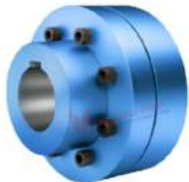
Khớp nối Flender N-Eupex A, B