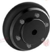
Khớp nối bánh xe Tyreflex