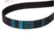
Dây curoa Classical Timing