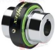
Khớp nối Wrapflex