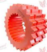
Vòng đệm cao su Sure-Flex