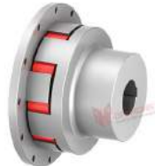
Khớp nối trực TNS SX