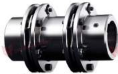
Steel Coupling Radex-N