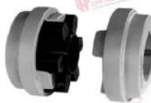
Khớp nối KE (HRC) Cross Morse