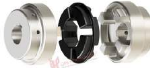
Khớp nối Magnaloy