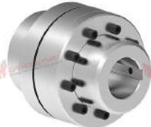
Khớp nối Nor-mex TNM G