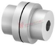
Khớp nối Nor-mex TNM E