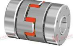
Khớp nối trực GWE 5112