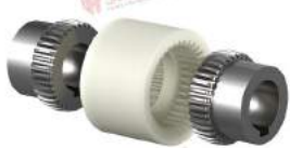
Khớp nối răng ECT 6418