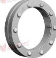
Thiết bị bóp trục RfN 4073