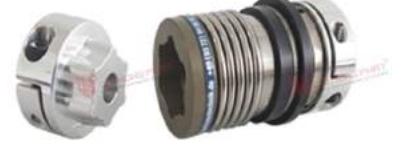
Khớp nối bảo vệ quá tải KBK BKPK