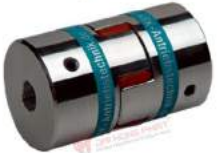
Khớp nối Servo KBK KBE1