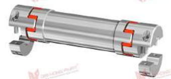
Khớp nối trực GWE Z5106.1