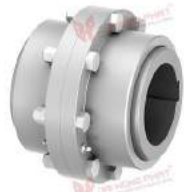
Khớp nối răng TNZ ZCAK/ZCBK