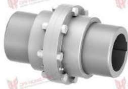
Khớp nối răng TNZ ZCAU/ZCBU