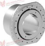
Khớp nối tang trống TNK TKVO