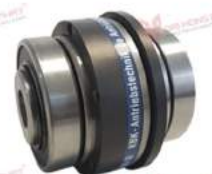
Khớp nối bảo vệ quá tải KBK LLA