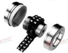
Khớp nối xích LRC Cross Morse