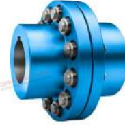
Khớp nối Flender Rupex RWS-RWN