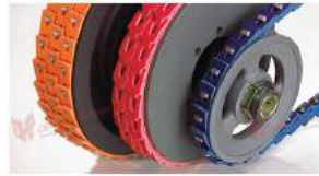
Dây curoa Power Twist PLUS