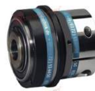
Khớp nối bảo vệ quá tải KBK LK