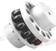
Khớp nối bu lông đai ốc B-Flex