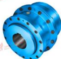
Khớp nối răng Zapex ZW