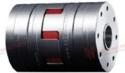
Khớp nối trực Rotex GS