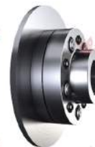
Pin and Bush Coupling With Disk Revolex KX-D SB