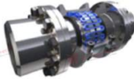
Khớp nối lưới lò xo PT T31