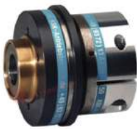
Khớp nối bảo vệ quá tải KBK CK