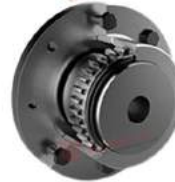
Khớp nối răng Gearflex