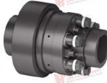
Khớp nối bảo vệ quá tải TNT 2425