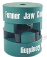
Khớp nối Fenner Dạng L