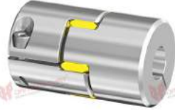
Khớp nối trực GWE 5103.1