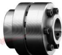
Khớp nối trực Poly-norm ADR