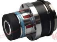
Khớp nối bảo vệ quá tải KBK EAP