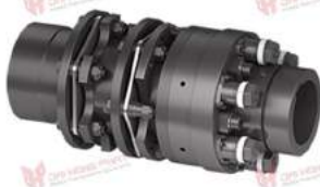
Khớp nối bảo vệ quá tải TNT 2424