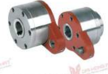
RIZ..G2G3 and RIZ..G3G4