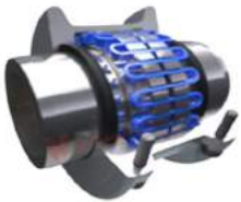
Khớp nối lưới lò xo PT T10