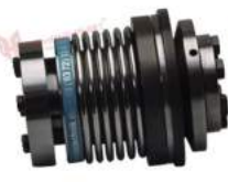
Khớp nối bảo vệ quá tải KBK BAI