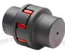
Khớp nối Type RRJ