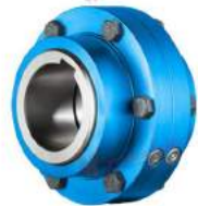
Khớp nối răng Zapex ZN