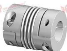
Khớp nối Encoder GWB AKN