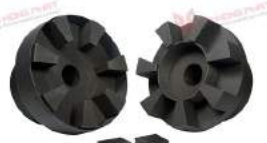
Khớp nối Type H/HR

A COUPLING SOLUTION FOR ALL APPLICATIONS - GIẢI PHÁP KHỚP NỐI TRỰC CHO MỌI ỨNG DỤNG