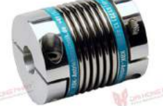
Khớp nối lò xo Encoder KBK K4C