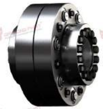
Pin and Bush Coupling With 650 clamping set