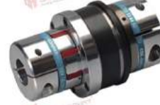
Khớp nối bảo vệ quá tải KBK EKK