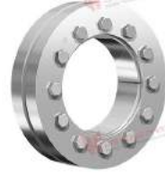
Thiết bị bóp trục RfN 4071