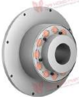
Khớp nối trực TNR 2424.1