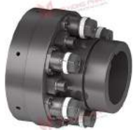
Khớp nối bảo vệ quá tải TNT 2420