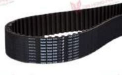
Dây curoa TDP3