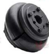
Khớp nối bánh xe T/TO