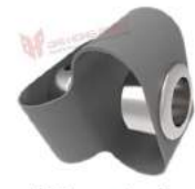
Khớp nối Encoder Loop Huco