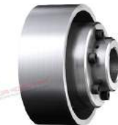
Khớp nối trực Poly-norm ADR-BTA