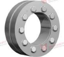
Thiết bị bóp trục RfN 4091