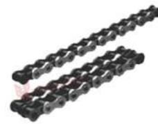
Xích Cross Morse