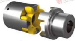
Khớp nối servo ECE 6418