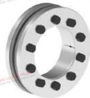
Thiết bị bóp trục RfN 4061