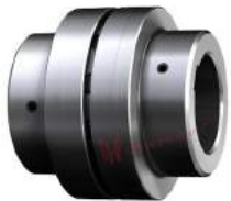
Khớp nối trực Poly-norm AR