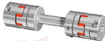
Khớp nối trực GWE Z5104.1