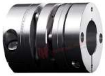
Servo Coupling Radex-NC