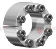
Khớp khóa trục RfN 7061