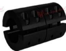
Khớp nối cứng KBK KBST-G