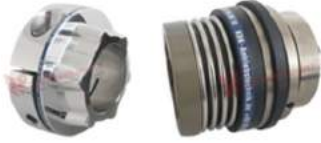
Khớp nối bảo vệ quá tải KBK BKPA