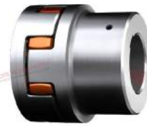
Khớp nối trực Rotex CFN