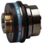
Khớp nối bảo vệ quá tải KBK CA