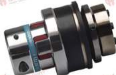
Khớp nối bảo vệ quá tải KBK EKA