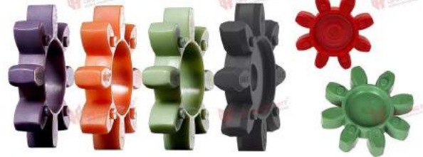
Vòng đệm giảm chấn Rotex