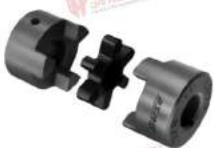
Khớp nối trục L Cross Morse