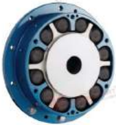
Khớp nối trực Renold PM