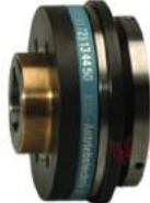
Khớp nối bảo vệ quá tải KBK CP