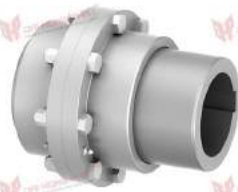
Khớp nối răng TNZ ZCAU/ZCBU