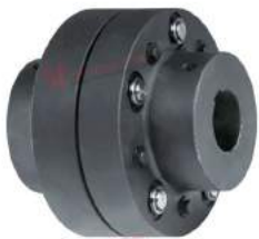
Pin and Bush Coupling Revolex KX-D made of cast iron