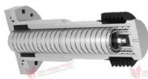
Vỏ bọc lò xo giảm sóc