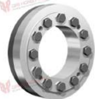
Thiết bị bóp trục RfN 4161 SST