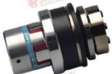
Khớp nối bảo vệ quá tải KBK EPA