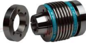
Khớp nối lò xo Encoder KBK KB6