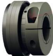
Safety Coupling Syntex-NC