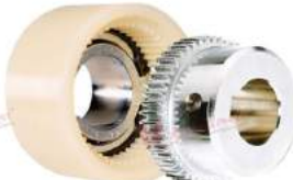
Khớp nối răng AS