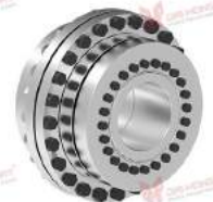
Khớp nối mặt bích TNF 5571