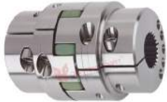
KTR Rotex Clamping Hub