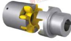
Khớp nối servo ECE 6118