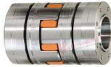
Rotex Clamping Ring Hub