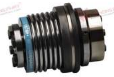
Khớp nối bảo vệ quá tải KBK BIA