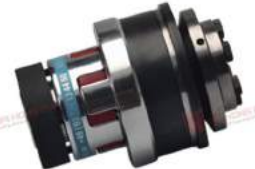
Khớp nối bảo vệ quá tải KBK EAI