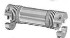
Khớp nối Encoder GWB Z5106

CÔNG TY ĐẠI HỒNG PHÁT - ĐẠI DIỆN ỦY QUYỀN RINGFEDER GERMANY DUY NHẤT TẠI VIỆT NAM