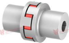
Khớp nối trực TNS S-LSt