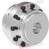
Khớp nối răng TNZ ZCA/ZCB