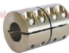
Khớp nối cứng KBK KBST-VA