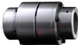
Khớp nối trực Poly-norm AZR