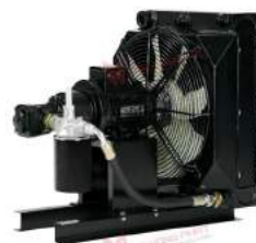
Oil/Air Cooler 2 - 110 kW