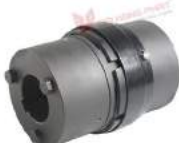
Khớp nối Type SWQ