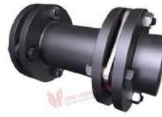
Khớp nối đĩa PTI