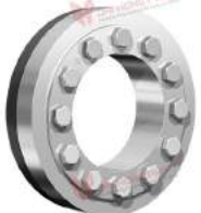
Thiết bị bóp trục RfN 4161