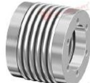
Khớp nối Encoder GWB CKN