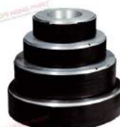
Damping rings KTR