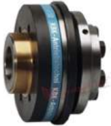
Khớp nối bảo vệ quá tải KBK CI