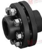
Khớp nối bu lông PTI