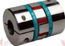
Khớp nối Servo KBK KBE2