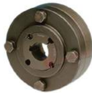
Khớp nối cứng Fenner