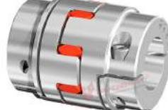
Khớp nối trực GWE 5104