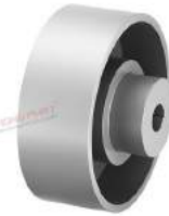
Khớp nối Nor-mex TNM EBT