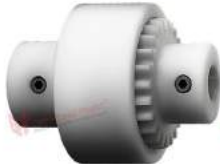
Khớp nối răng Bowex Junior