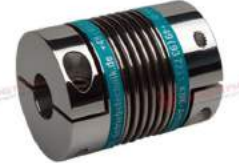
Khớp nối lò xo Encoder KBK KB4