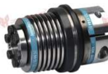
Khớp nối bảo vệ quá tải KBK BIK