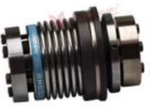
Khớp nối bảo vệ quá tải KBK BAA