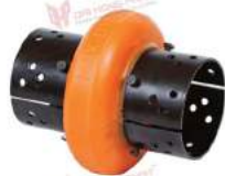
Khớp nối trực Max Dynamic Spacer