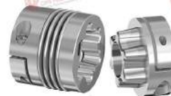
Khớp nối Encoder GWB PKA