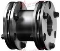
Steel Coupling Radex-N NENE