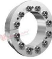
Khớp khóa trục RfN 7006