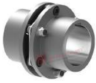
Khớp nối đĩa thép TND HSH