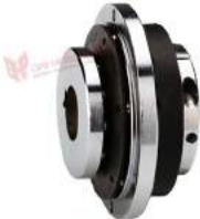
Safety Coupling Syntex