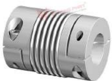
Khớp nối Encoder GWB AKD