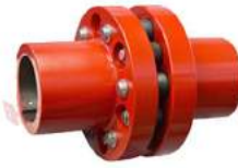
Khớp nối trục Westcar Rotopin