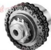
Khớp nối bảo vệ quá tải Cross Morse