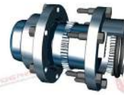
Khớp nối răng vỏ thép JAC SEM