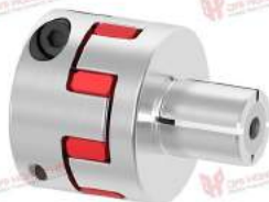
Khớp nối trực GWE 5117