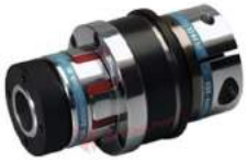
Khớp nối bảo vệ quá tải KBK EAK