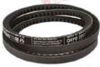
Dây curoa Quattro PLUS CRE