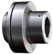
Khớp nối trực Poly PKZ