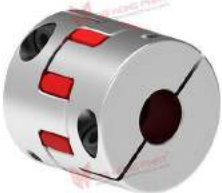
Khớp nối trực GWE 5113