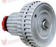
Khớp nối thủy lực Westcar CA