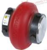
Khớp nối trực Max Dynamic HT