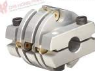
Khớp nối đĩa Flex M