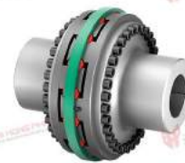
Khớp nối trực TNB BHDDV