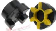
Khớp nối trục JAC CR