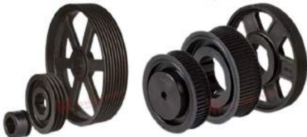
Puly Belt Timing