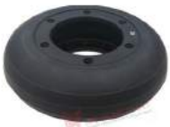
Vòng đệm bán xe JAC CA