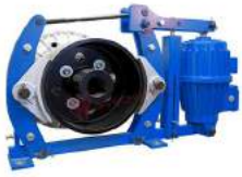
Phanh thủy lực dạng tang trống