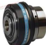
Khớp nối bảo vệ quá tải KBK LA