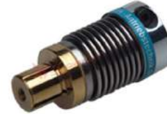
Khớp nối lò xo Encoder KBK KB3