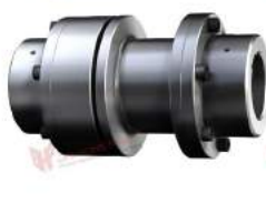
Khớp nối trực Poly PKA