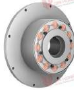
Khớp nối trực TNR 2425.1