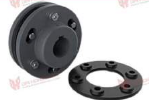
Khớp nối đĩa Discflex