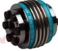
Khớp nối lò xo Encoder KBK KB5