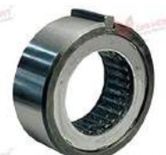
Bộ chống quay ngược B200 & B500

A COUPLING SOLUTION FOR ALL APPLICATIONS - GIẢI PHÁP KHỚP NỐI TRỤC CHO MỌI ỨNG DỤNG