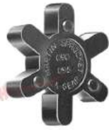
Vòng đệm giảm chấn Martin ML