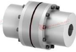
Khớp nối Nor-mex TNM H