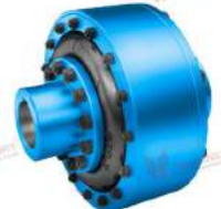
Khớp nối bánh xe Elpex