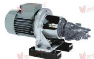
Bell Housing Aluminium