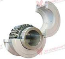
Khớp nối lưới lò xo Westcar