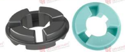
Vòng đệm giảm chấn Magnaloy