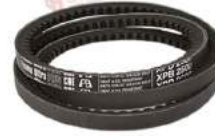
Dây curoa Ultra PLUS CRE