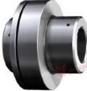
Khớp nối trực Poly PKD