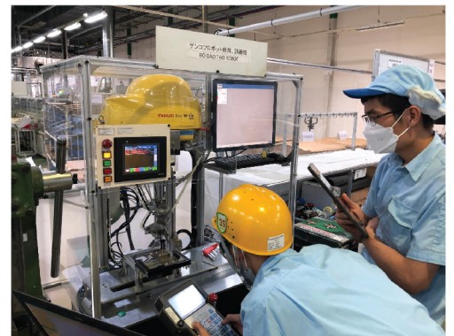
Đào tạo về xử lý ảnh tại khách hàng Vision training course at customer