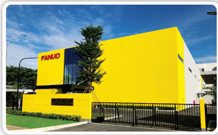
Ho Chi Minh Head Office