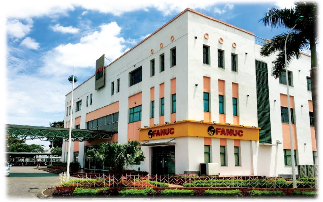
Hanoi Branch Office

CÔNG TY TNHH FANUC VIỆT NAM được thành lập năm 2002. Chúng tôi cung cấp các sản phẩm ROBOT và ROBOMA-CHINE và cung cấp dịch vụ bảo trì cho các sản phẩm của FANUC tại lãnh thổ Việt Nam.