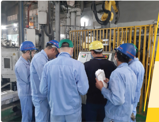
Đào tạo tại Khách hàng Training Course at customer